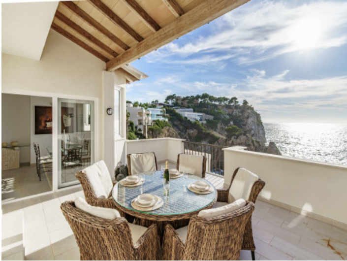
Terrasse ertse Meereslinie