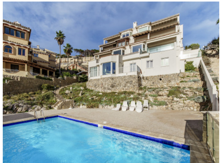
Gemeinschaftspool direkt am Meer