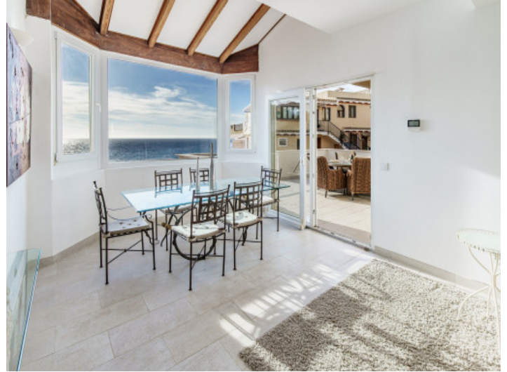
Essbereich mit Panoramameerblick