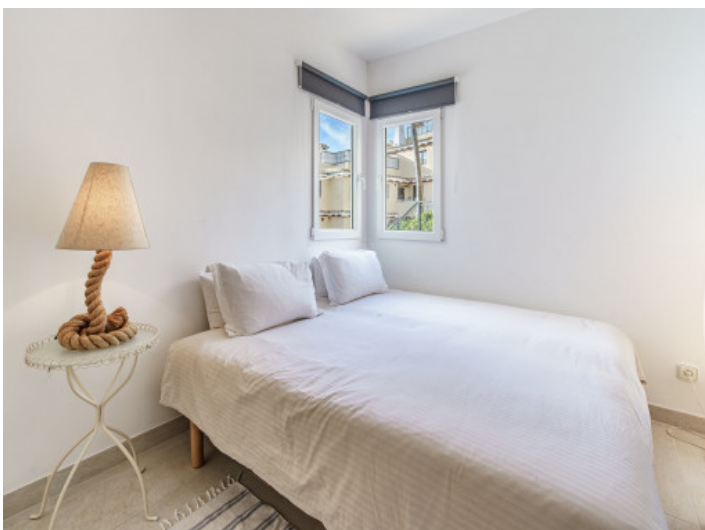
Eines der 3 Schlafzimmer