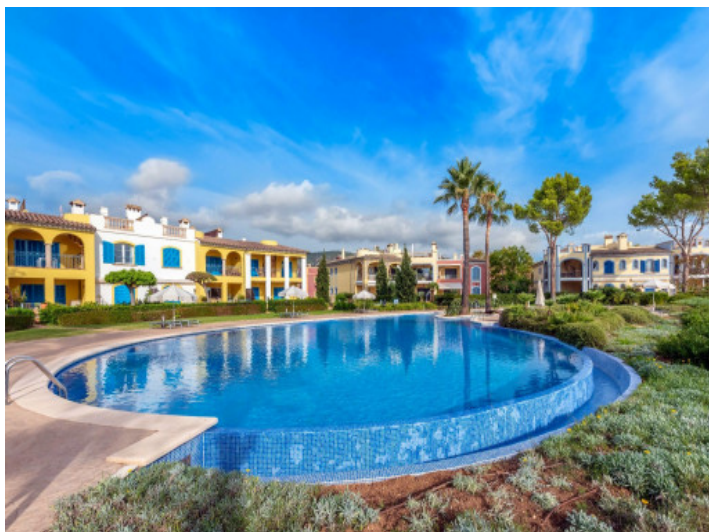
Sehr gepflegte Wohnanlage in Bendinat