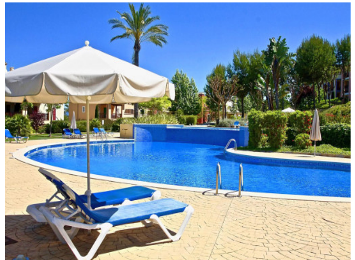
Einer der drei Pools

Alle Angaben nach bestem Wissen. Irrtum und Zwischenverkauf vorbehalten. Dieses Exposé ist eine Vorinformation, als Rechtsgrundlage gilt allein der notariell abgeschlossene Kaufvertrag.