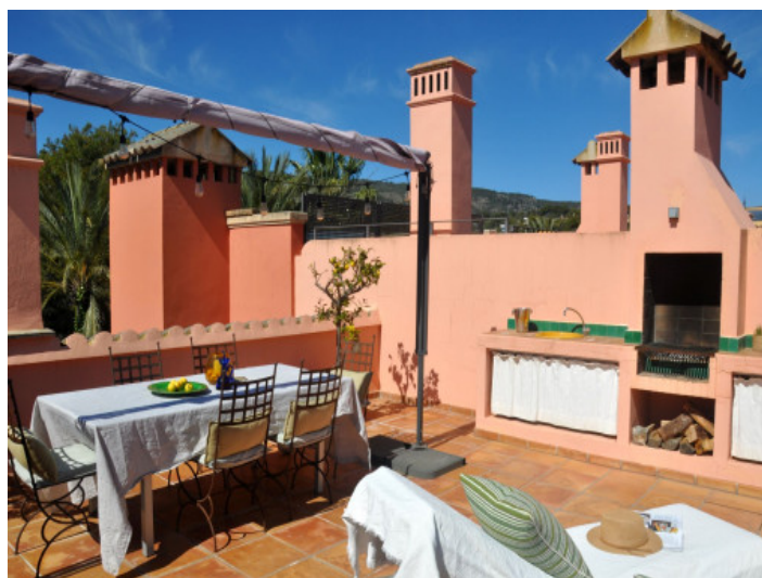
Terrasse mit Grillbereich