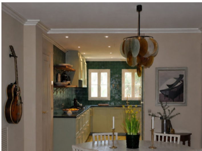
Wohnbereich und voll ausgestattete Miele-Küche