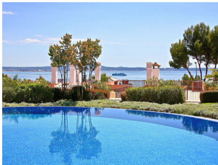
Einer der drei Gemeinschaftspools mit Meerblick