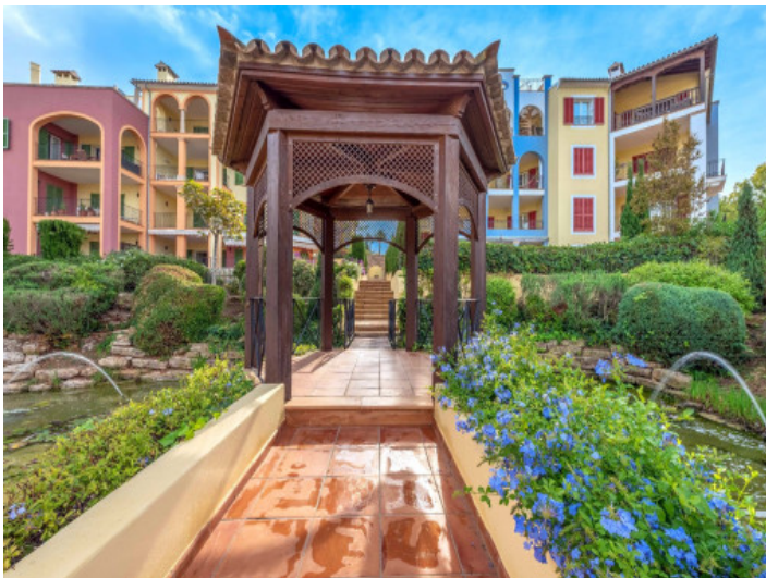
Wohnanlage in Bendinat, nahe dem Meer und dem Golfplatz