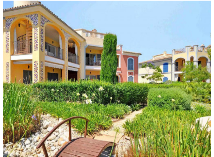
Wohnanlage mit mediterranem Garten