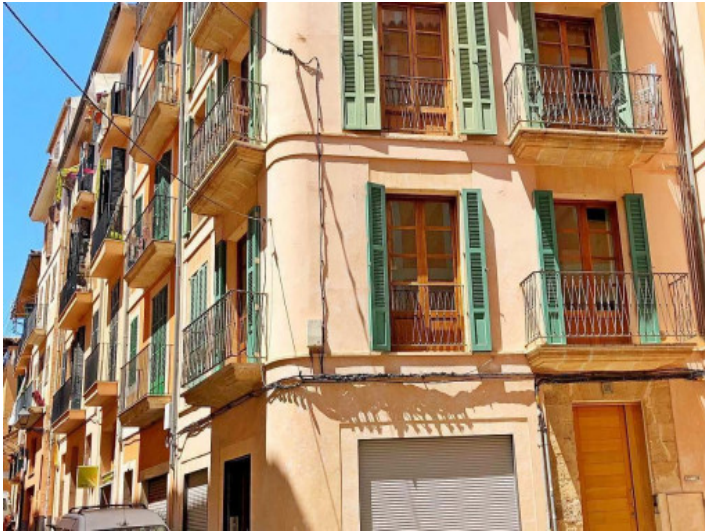
Außenansicht des Gebäudes