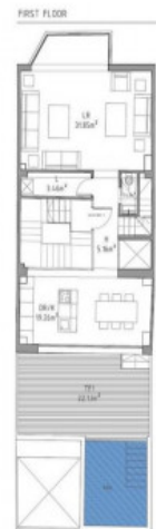
Bauzeichnung des ersten Stockwerks