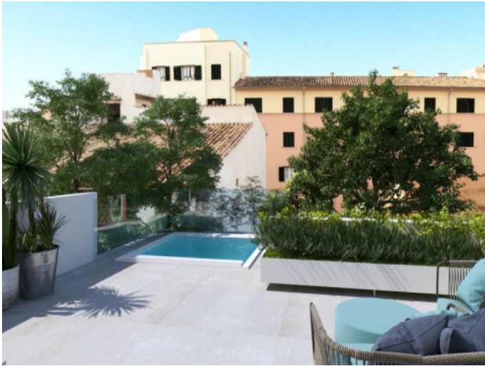
Exklusives Apartment mit Pool in Santa Catalina