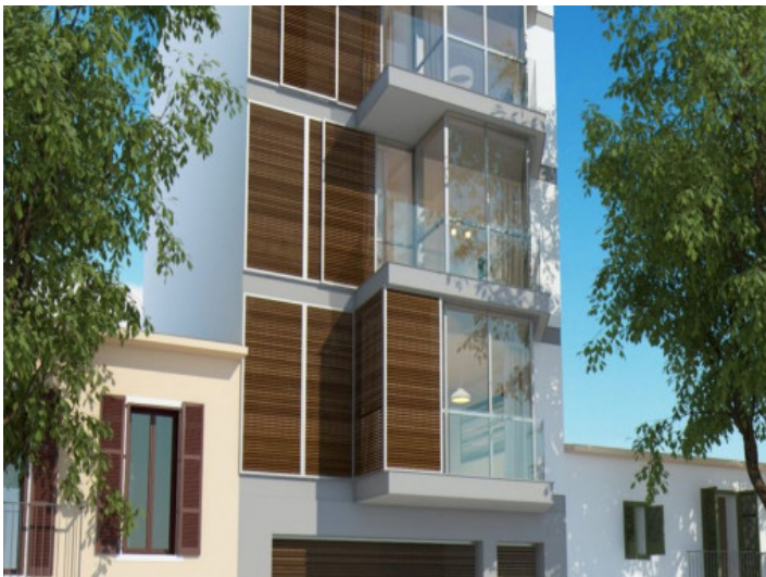
Aussenansicht des Wohngebäudes