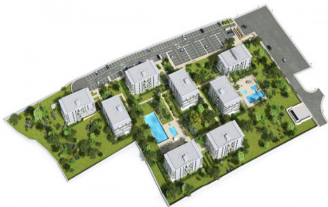
Übersicht der Anlage