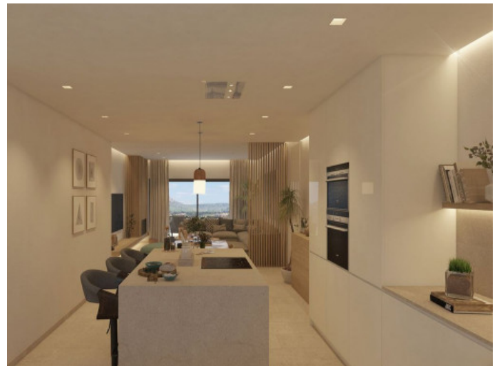
Offene mit Küche mit Essbereich