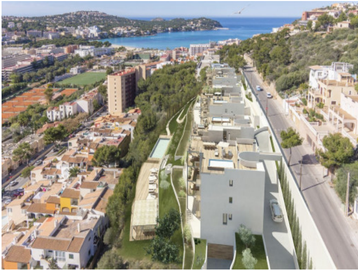
Außenansicht des Wohnhauses