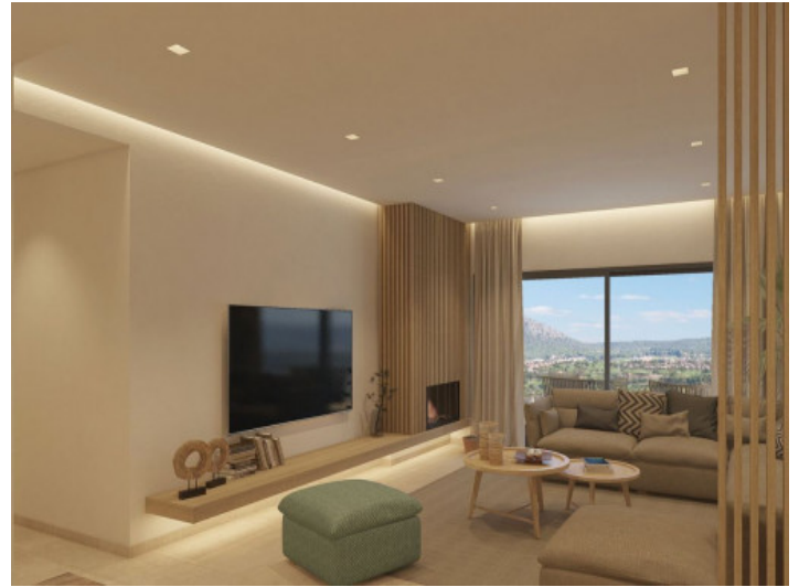
Wohnzimmer mit Aussicht