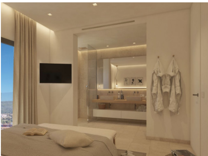
Schlafzimmer en Suite