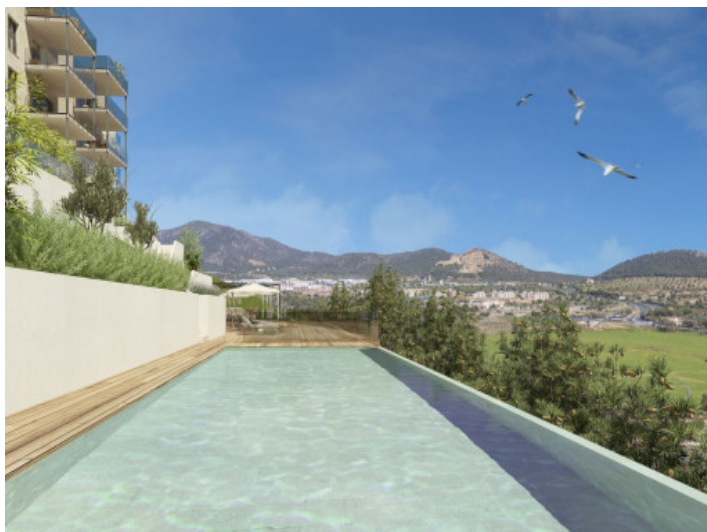
Poolbereich des Wohnhauses