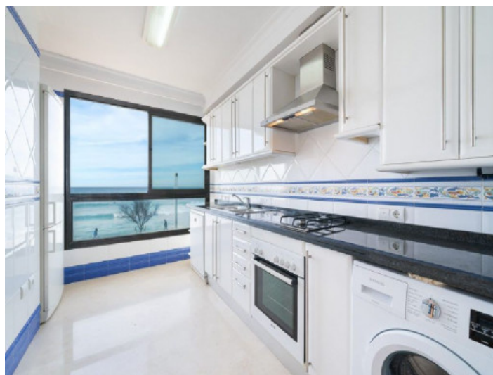
Küche mit Meerblick