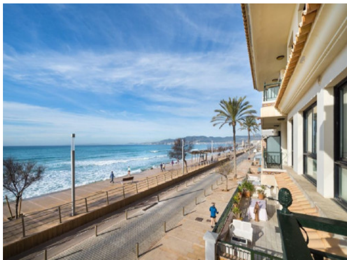
Balkon mit Meerblick