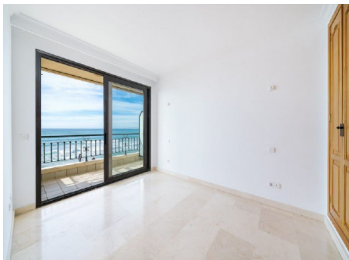
Eines von 3 Badezimmern