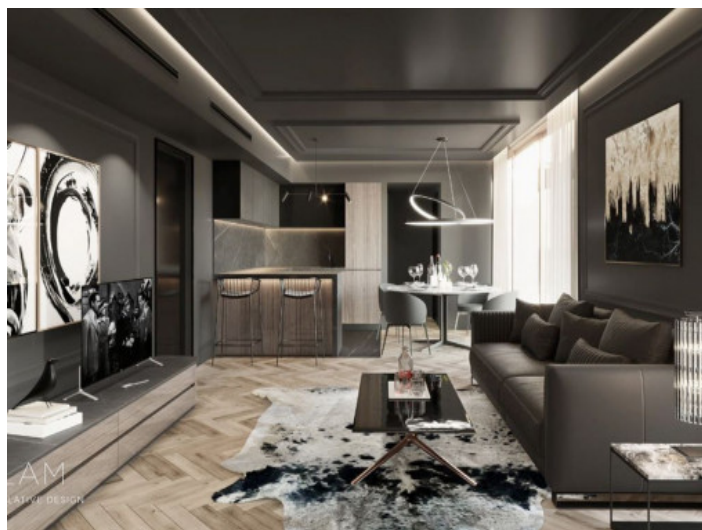
Wohn- und Essbereich - Glam

Alle Angaben nach bestem Wissen. Irrtum und Zwischenverkauf vorbehalten. Dieses Exposé ist eine Vorinformation, als Rechtsgrundlage gilt allein der notariell abgeschlossene Kaufvertrag.