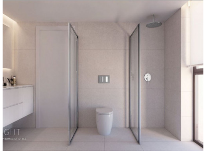
Badezimmer - Light