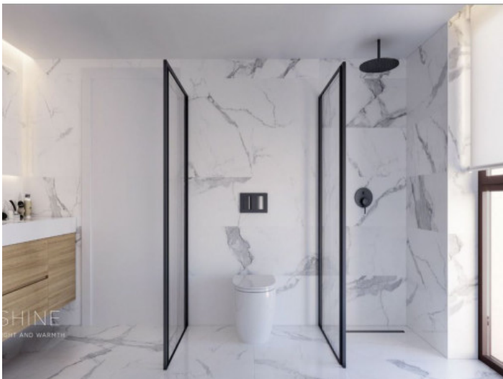
Badezimmer - Shine