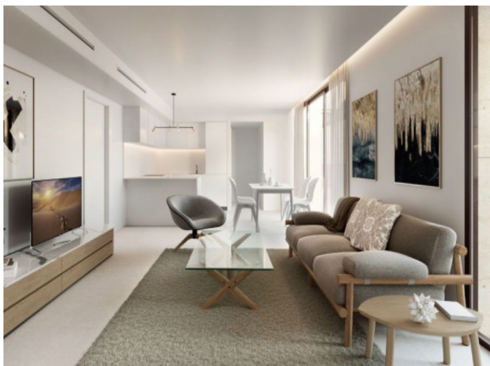
Wohn- und Essbereich - Light