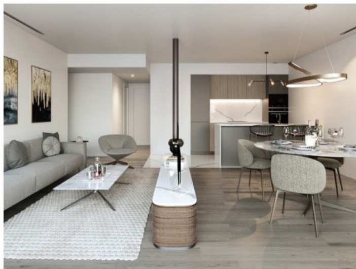
Wohn- und Essbereich - Shine