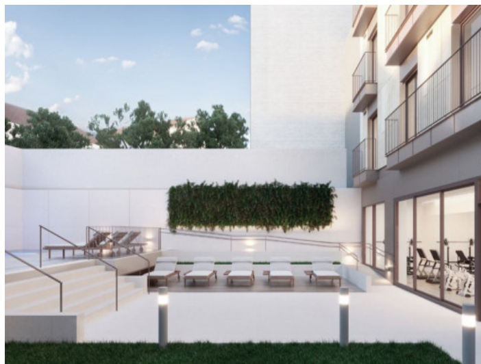
Terrassen, Pool und Fitnessbereich