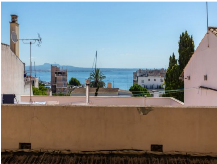
Blick bis zum Meer