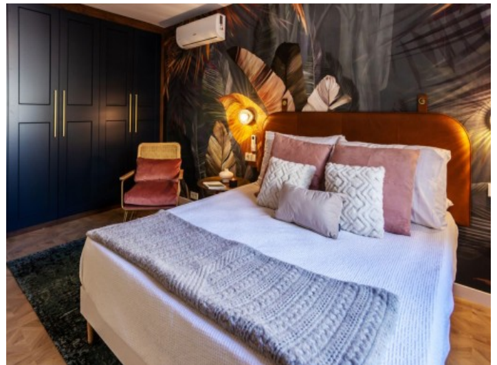
Eines von 5 Schlafzimmern