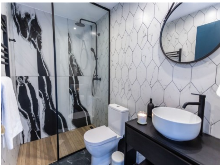
Eines von 5 Badezimmern