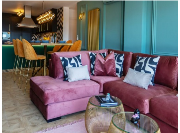
Offener Wohn-und Essbereich