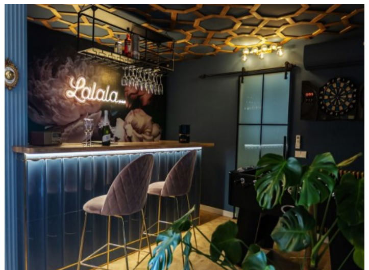
Bar neben der Küche

Alle Angaben nach bestem Wissen. Irrtum und Zwischenverkauf vorbehalten. Dieses Exposé ist eine Vorinformation, als Rechtsgrundlage gilt allein der notariell abgeschlossene Kaufvertrag.