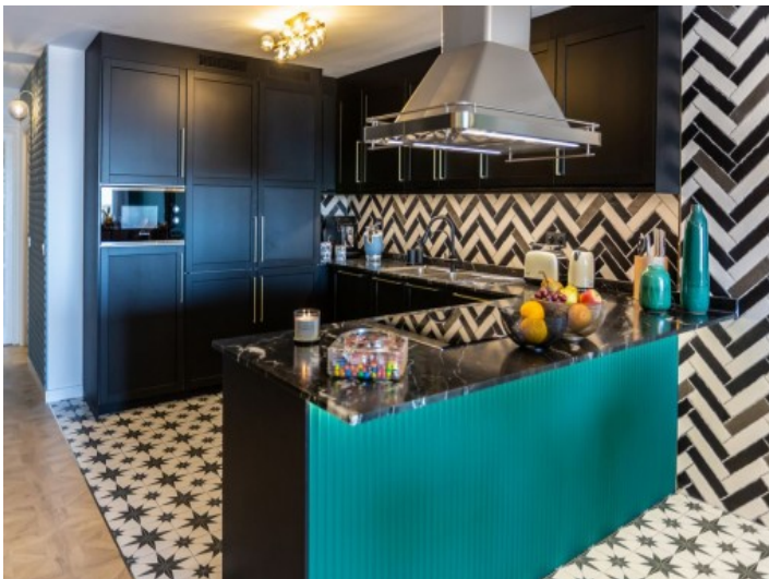
Moderne Küche in schwarz