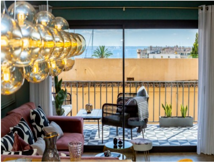
Wohnbereich mit Meerblick