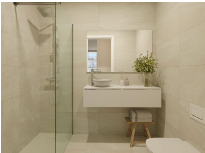
Badezimmer mit ebenerdiger Dusche