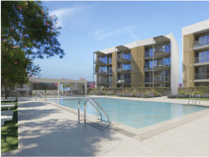
Einladender Poolbereich der Wohnanlage