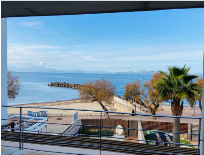
Balkon mit Meerblick