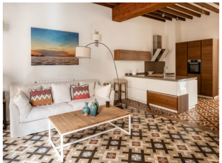
Küche und offener Wohnbereich

Alle Angaben nach bestem Wissen. Irrtum und Zwischenverkauf vorbehalten. Dieses Exposé ist eine Vorinformation, als Rechtsgrundlage gilt allein der notariell abgeschlossene Kaufvertrag.