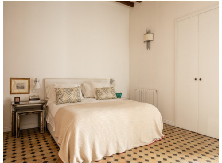
Schlafzimmer mit Natursteinwand