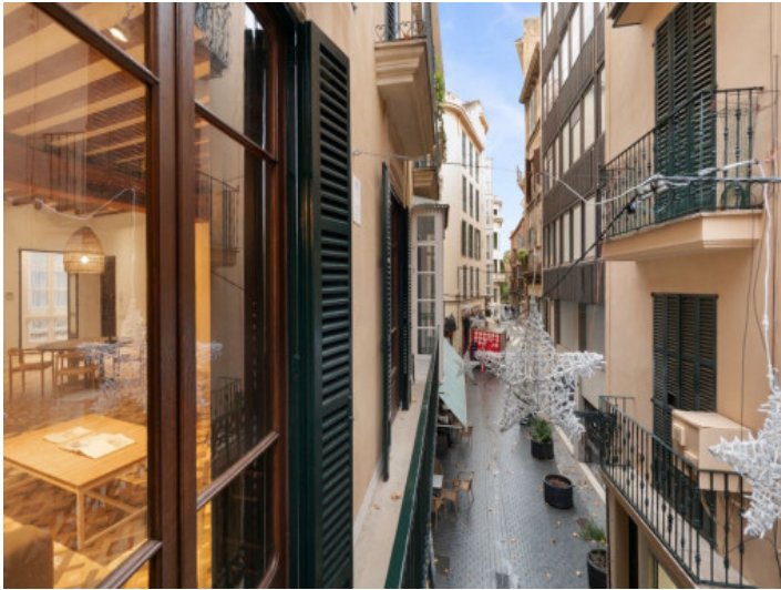
Blick in die Straße