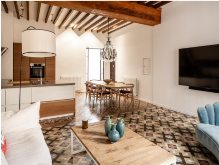
Küche und offener Wohnbereich