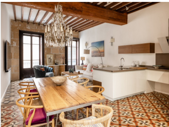
Küche und offener Wohnbereich