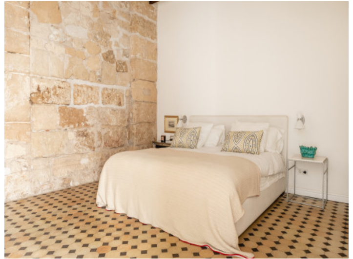
Schlafzimmer mit Natursteinwand