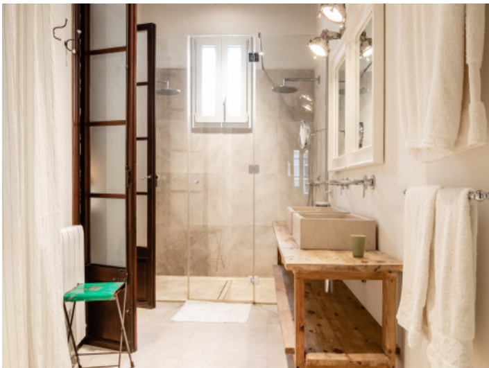
Modernes Badezimmer mit ebenerdiger Dusche