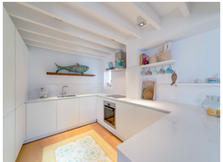
Moderne Küche mit viel Platz

Alle Angaben nach bestem Wissen. Irrtum und Zwischenverkauf vorbehalten. Dieses Exposé ist eine Vorinformation, als Rechtsgrundlage gilt allein der notariell abgeschlossene Kaufvertrag.