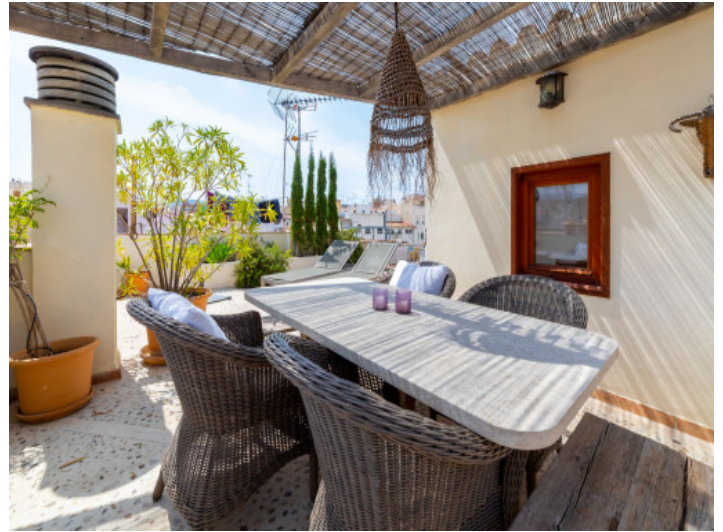
Überdachter Essbereich im Freien