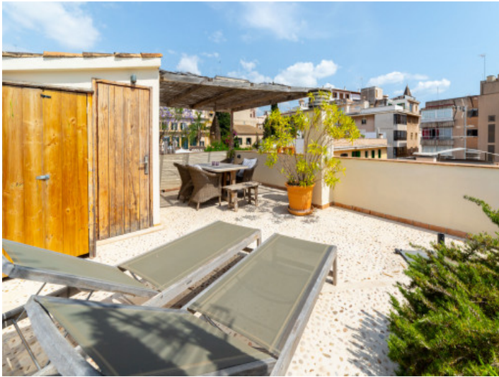
Fantastische Dachterrasse im Herzen von Palma