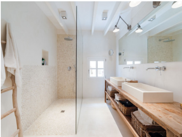
Schön eingerichtetes Badezimmer