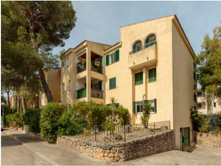
Ansicht des Gebäudes