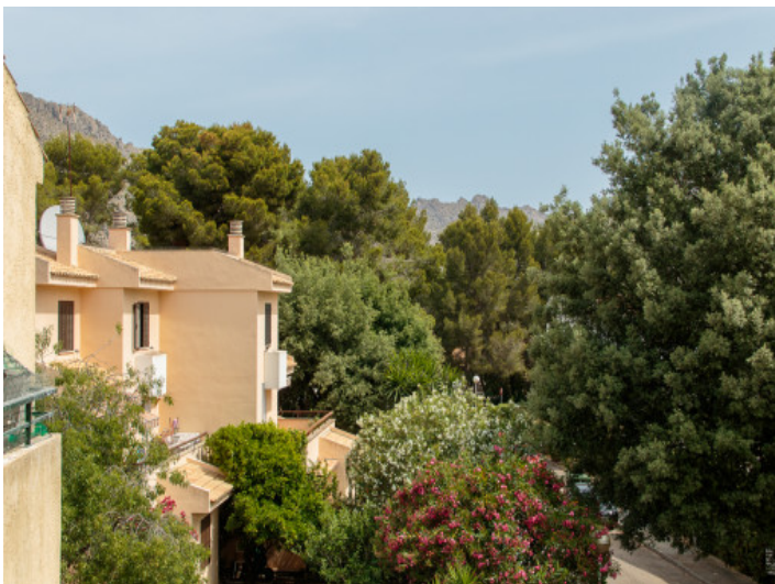
Blick von der Wohnung