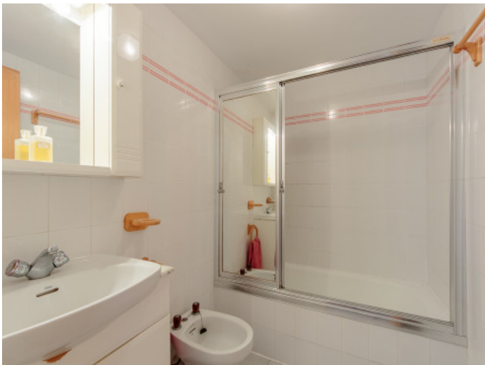
Badezimmer mit Wanne