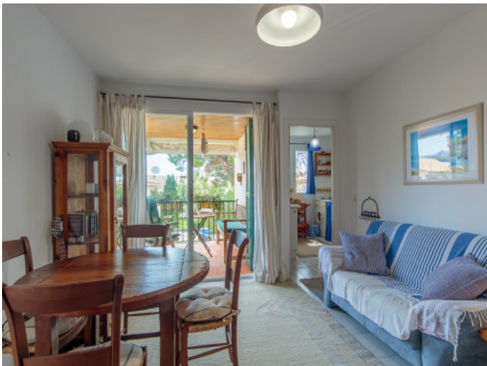
Wohnbereich mit Balkon