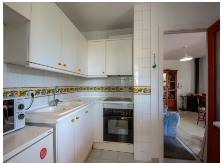
Zugang zum Wohnbereich

Alle Angaben nach bestem Wissen. Irrtum und Zwischenverkauf vorbehalten. Dieses Exposé ist eine Vorinformation, als Rechtsgrundlage gilt allein der notariell abgeschlossene Kaufvertrag.