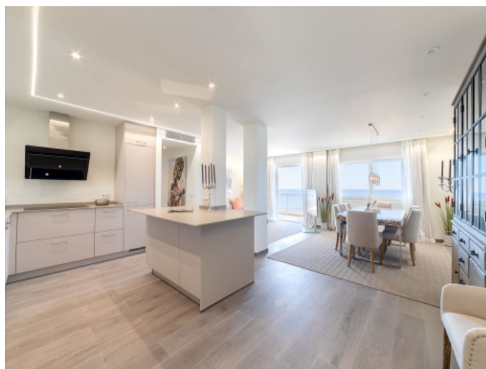
Moderne Küche mit Insel