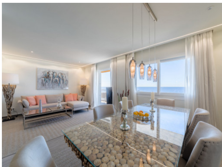
Wohn-/Essbereich mit Meerblick