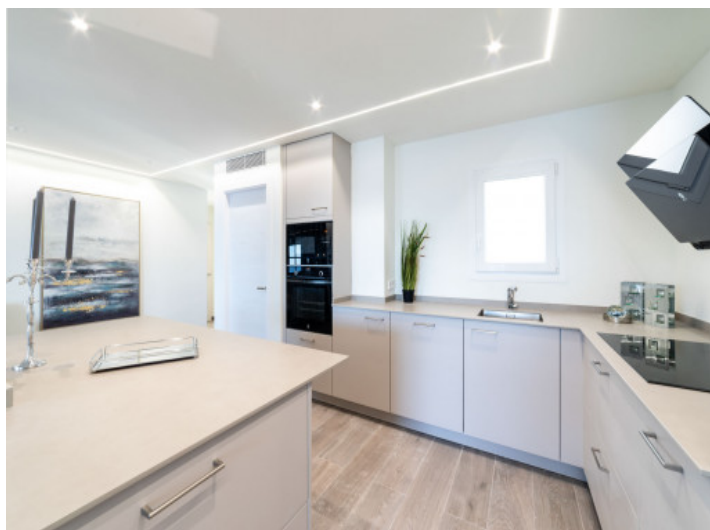
Komplett ausgestattete Küche