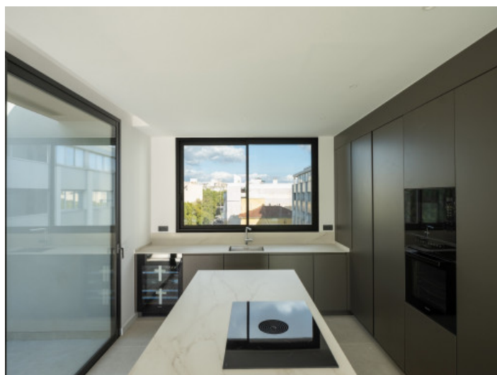
Moderne, voll ausgestattete Küche