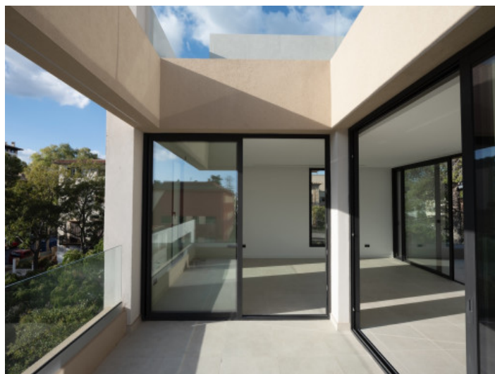
Eine von insgesamt drei Terrassen auf der Wohnebene

Alle Angaben nach bestem Wissen. Irrtum und Zwischenverkauf vorbehalten. Dieses Exposé ist eine Vorinformation, als Rechtsgrundlage gilt allein der notariell abgeschlossene Kaufvertrag.