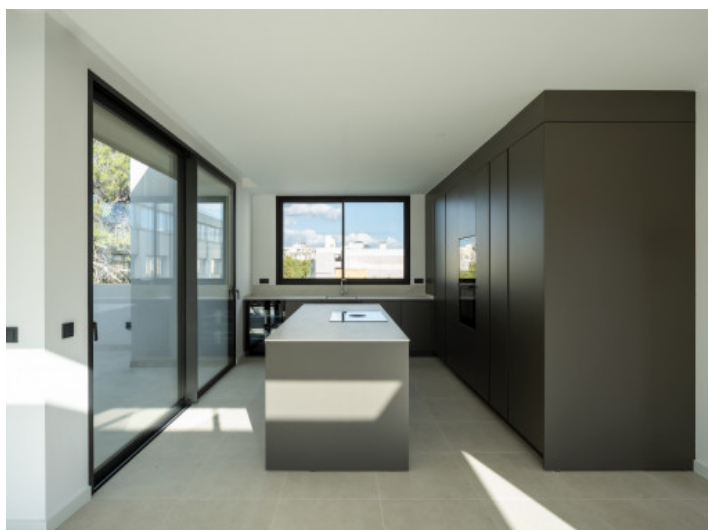
Offene Küche mit Zugang zur Terrasse