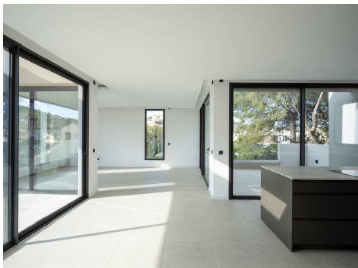
Großzügiger, heller Wohnbereich