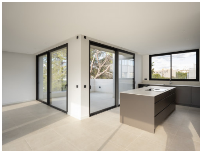
Aufgeschlossene Wohnräume mit integrierter Küche