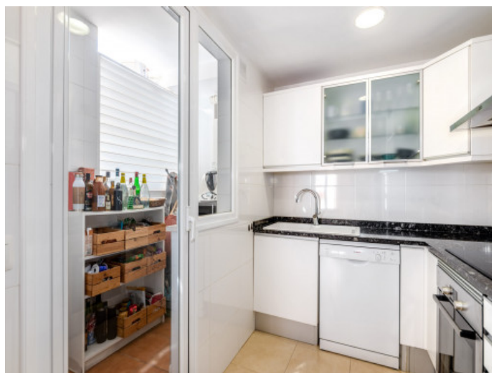
Küche und kleiner Haushaltsraum