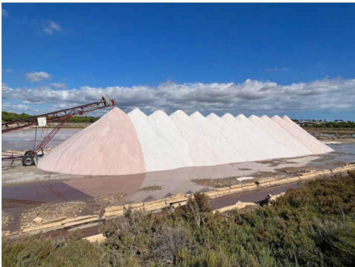
Salinen von Es Trenc