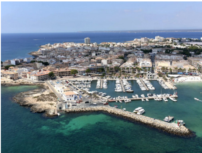
Hafen von Colonia Sant Jordi

Alle Angaben nach bestem Wissen. Irrtum und Zwischenverkauf vorbehalten. Dieses Exposé ist eine Vorinformation, als Rechtsgrundlage gilt allein der notariell abgeschlossene Kaufvertrag.