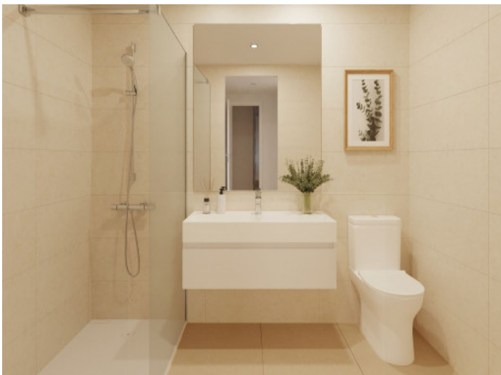
Badezimmer mit bodentiefer Dusche