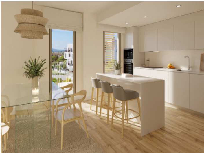
Ess- und Küchenbereich