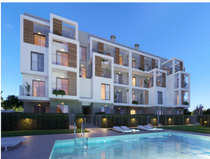
Pool und Ansicht auf den Wohnkomplex