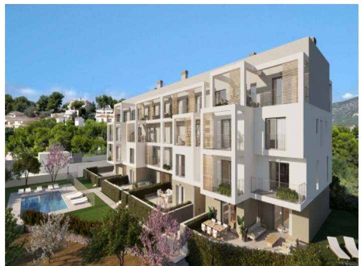
Pool, Garten und Fassade

Alle Angaben nach bestem Wissen. Irrtum und Zwischenverkauf vorbehalten. Dieses Exposé ist eine Vorinformation, als Rechtsgrundlage gilt allein der notariell abgeschlossene Kaufvertrag.