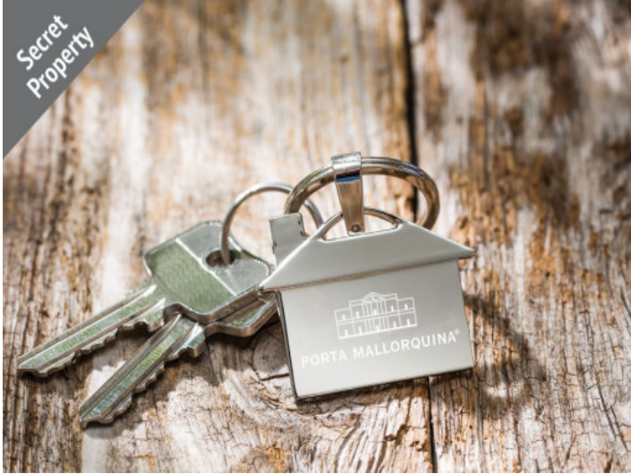
Wohnung in Portocristo

Alle Angaben nach bestem Wissen. Irrtum und Zwischenverkauf vorbehalten. Dieses Exposé ist eine Vorinformation, als Rechtsgrundlage gilt allein der notariell abgeschlossene Kaufvertrag.