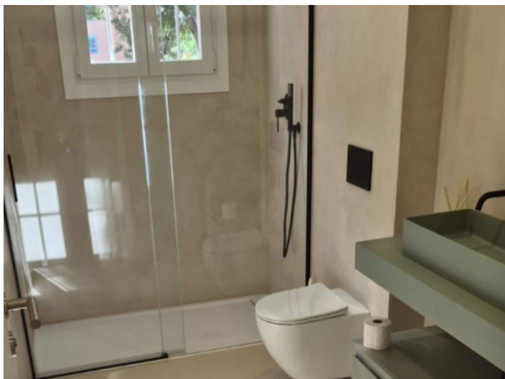
Elegantes Badezimmer mit Dusche und Fenster