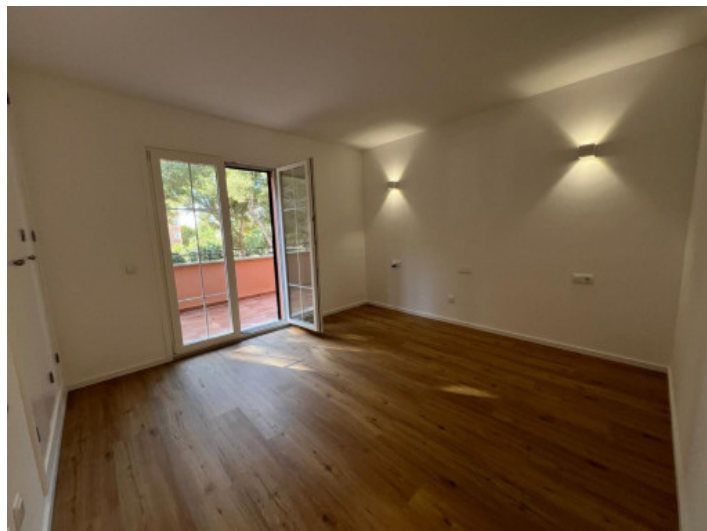
Helles Zimmer mit Balkon

Alle Angaben nach bestem Wissen. Irrtum und Zwischenverkauf vorbehalten. Dieses Exposé ist eine Vorinformation, als Rechtsgrundlage gilt allein der notariell abgeschlossene Kaufvertrag.