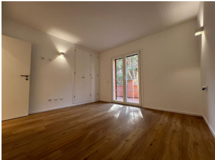
Schlafzimmer mit Einbauschränk und Zugang zur Terrasse