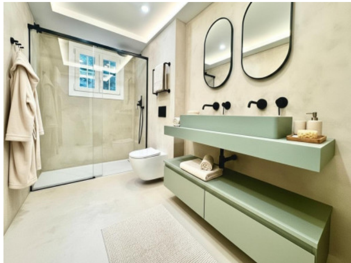
Elegantes Badezimmer mit Dusche und Fenster