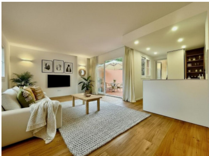
Visualisierung des Wohn-Essbereichs