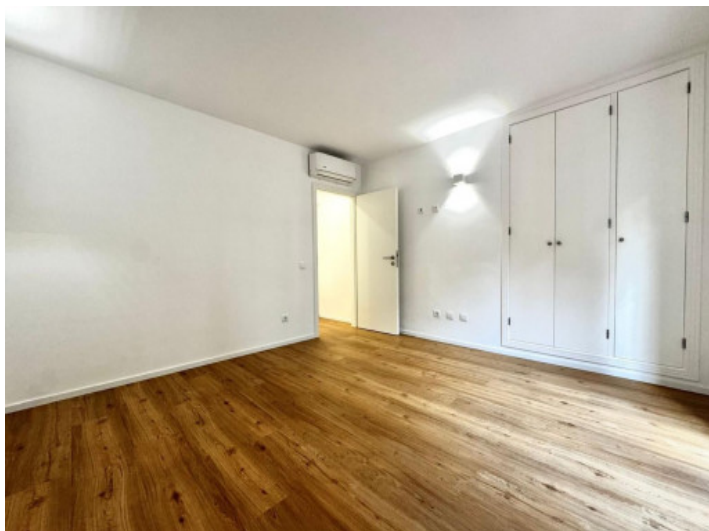
Schlafzimmer mit Einbauschränk