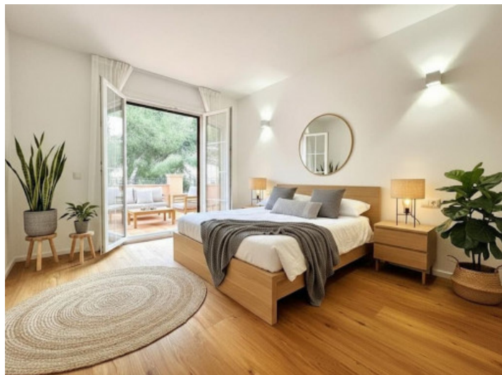
So könnte Ihr Schlafzimmer mit Terrasse aussehen

Alle Angaben nach bestem Wissen. Irrtum und Zwischenverkauf vorbehalten. Dieses Exposé ist eine Vorinformation, als Rechtsgrundlage gilt allein der notariell abgeschlossene Kaufvertrag.