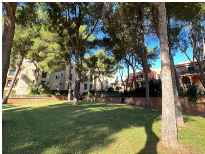
Grüne Außenanlage mit Bäumen