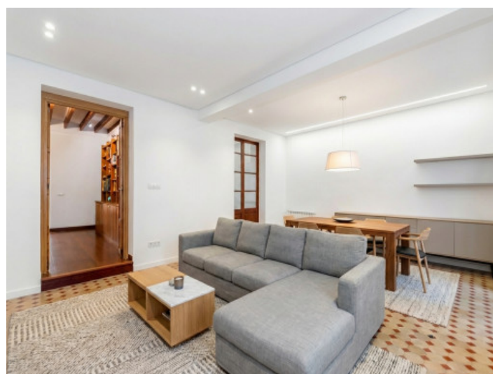
KI generiert - mögliche Modernisierung