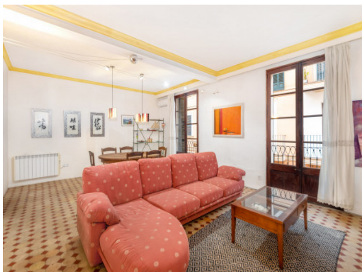
Altstadt Wohnung in Palma