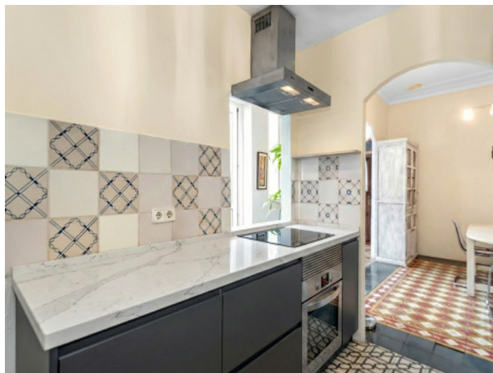
KI generiert - mögliche Modernisierung