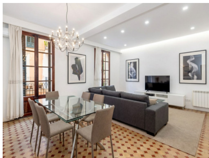
KI generiert - mögliche Modernisierung

Alle Angaben nach bestem Wissen. Irrtum und Zwischenverkauf vorbehalten. Dieses Exposé ist eine Vorinformation, als Rechtsgrundlage gilt allein der notariell abgeschlossene Kaufvertrag.