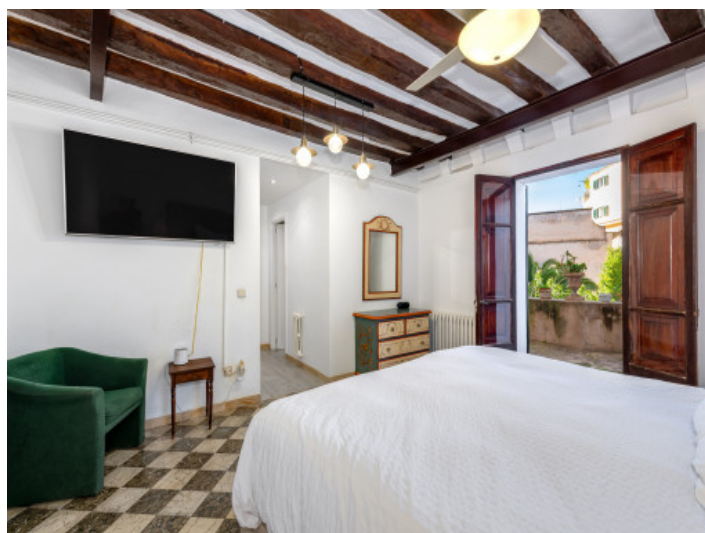
Schlafzimmer mit Badezimmer