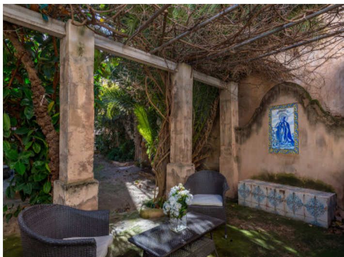
Ecke des Gartens