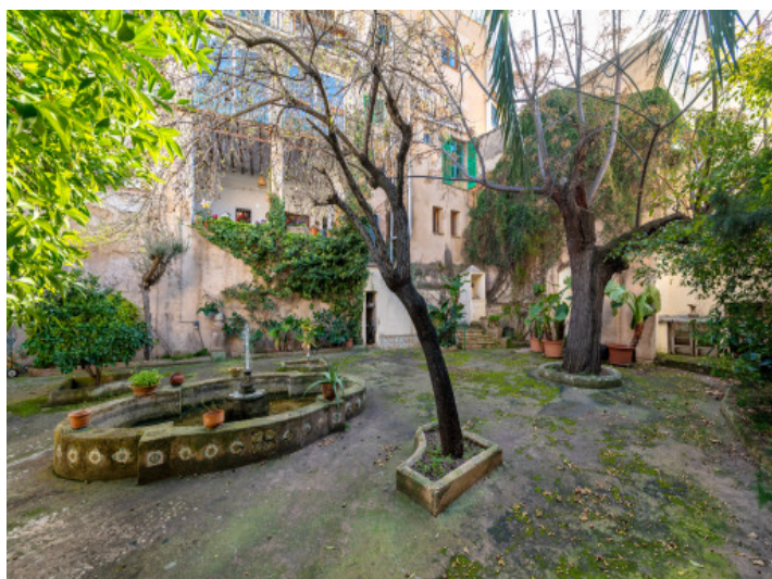
Garten mit patio