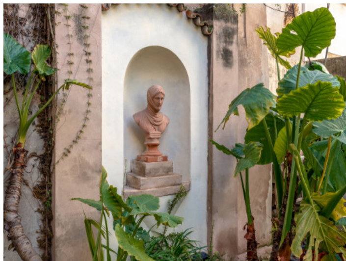
Detail des Gartens