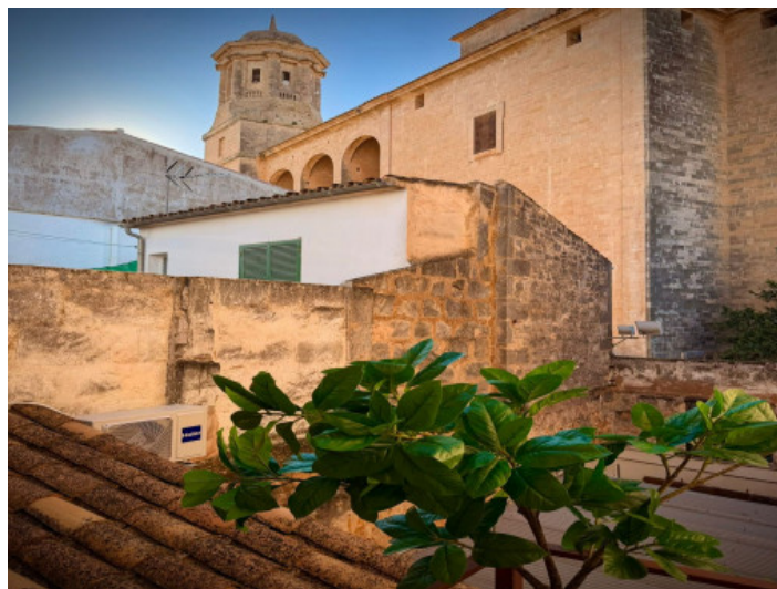
Kirche in Llucmajor

Alle Angaben nach bestem Wissen. Irrtum und Zwischenverkauf vorbehalten. Dieses Exposé ist eine Vorinformation, als Rechtsgrundlage gilt allein der notariell abgeschlossene Kaufvertrag.