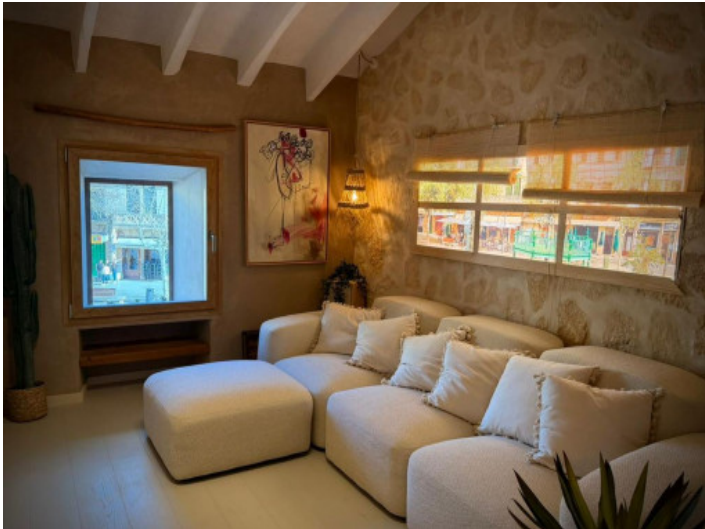
Wohnzimmer mit Blick auf den Plaza