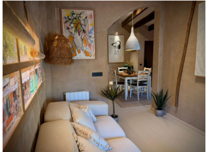
Wohn und Esszimmer