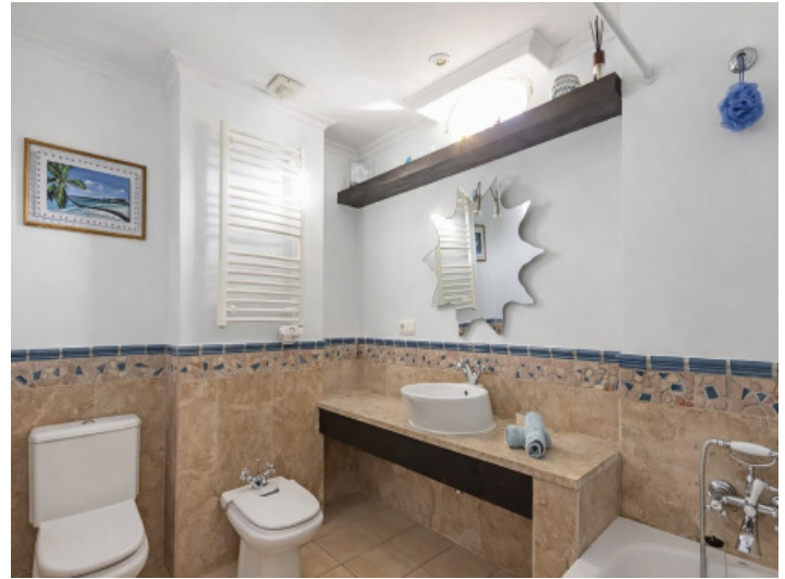
Eines der 2 Badezimmer