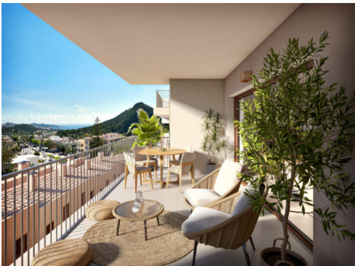
Terrasse mit Blick