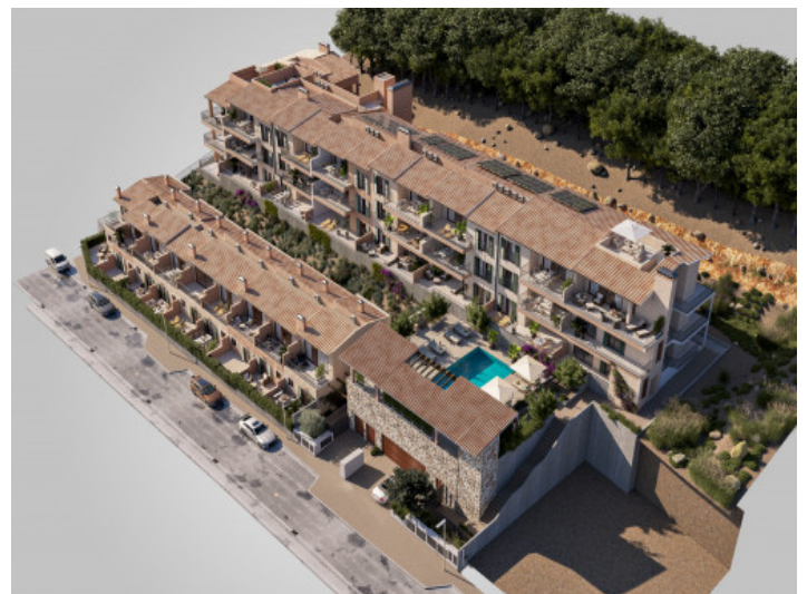
Neubau Anlage Capdepera-zentral

Alle Angaben nach bestem Wissen. Irrtum und Zwischenverkauf vorbehalten. Dieses Exposé ist eine Vorinformation, als Rechtsgrundlage gilt allein der notariell abgeschlossene Kaufvertrag.