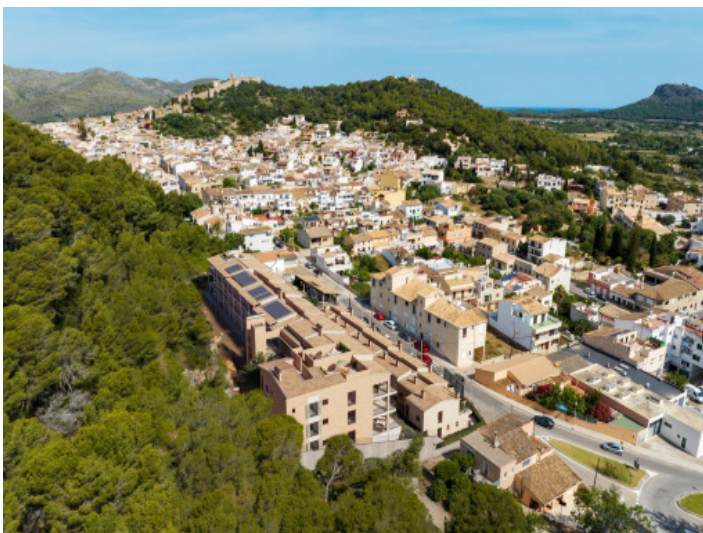
Lage der Anlage