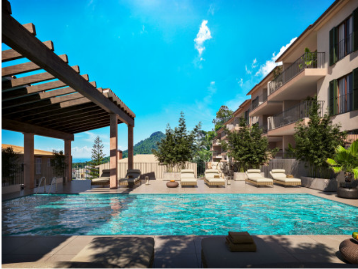
Pool mit Liegen