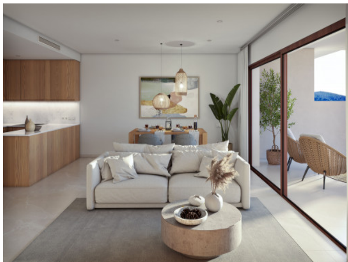
Wohnzimmer mit Terrasesse-terrasse