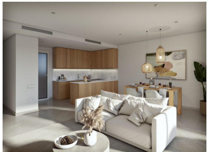
Wohnzimmer mit Küche

Alle Angaben nach bestem Wissen. Irrtum und Zwischenverkauf vorbehalten. Dieses Exposé ist eine Vorinformation, als Rechtsgrundlage gilt allein der notariell abgeschlossene Kaufvertrag.