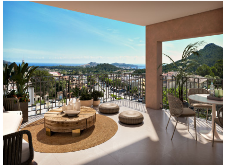
Terrasse mit Blick