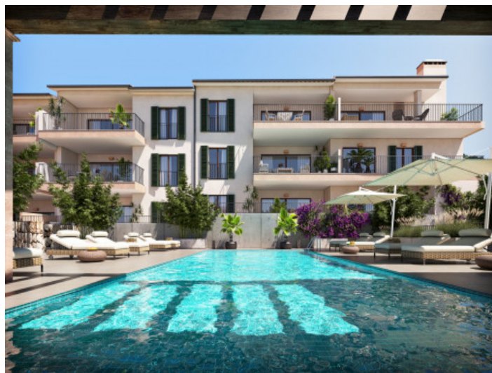
Neubauwohnungen in Capdepera