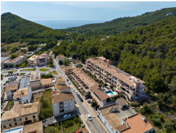
Lage der Residenz