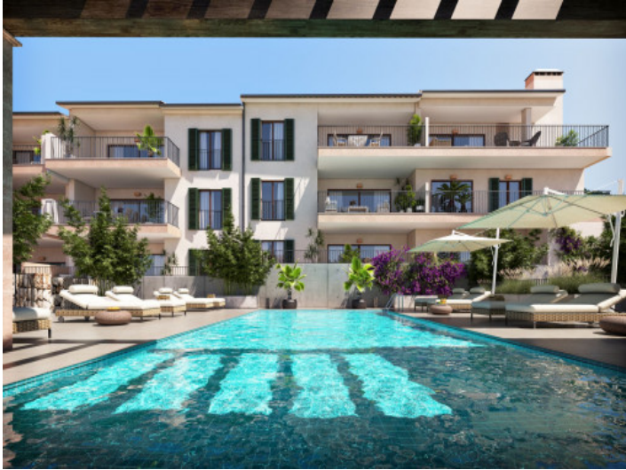
Neubauwohnungen in Capdepera