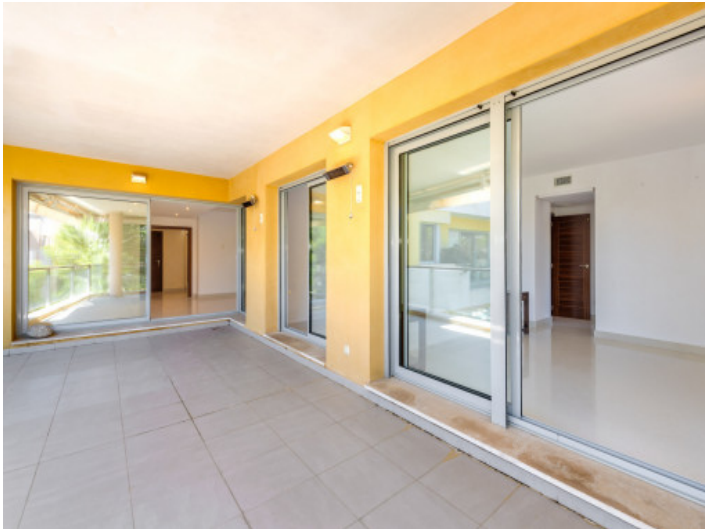
Überdachte Terrasse der Wohnebene