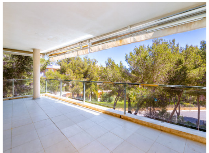
Überdachte Terrasse der Wohnebene

Alle Angaben nach bestem Wissen. Irrtum und Zwischenverkauf vorbehalten. Dieses Exposé ist eine Vorinformation, als Rechtsgrundlage gilt allein der notariell abgeschlossene Kaufvertrag.