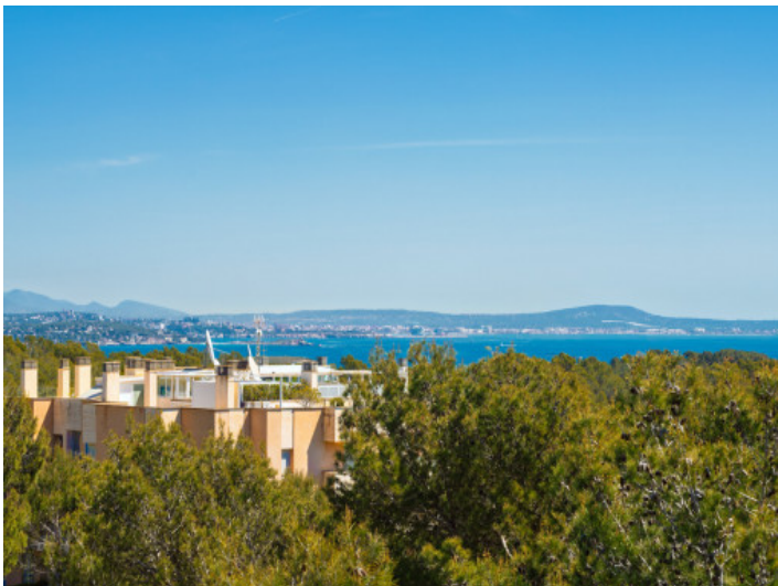
Teil-Meerblick von der Dachterrasse