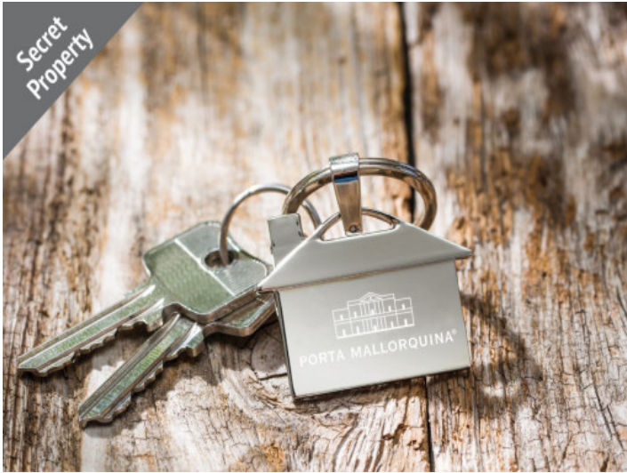
Moderne Altstadtwohnung in Palma