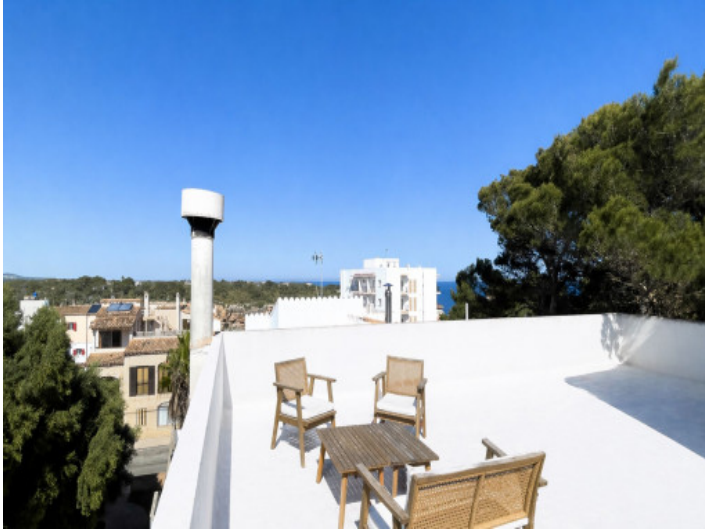
Dachterrassen mit Meerblick